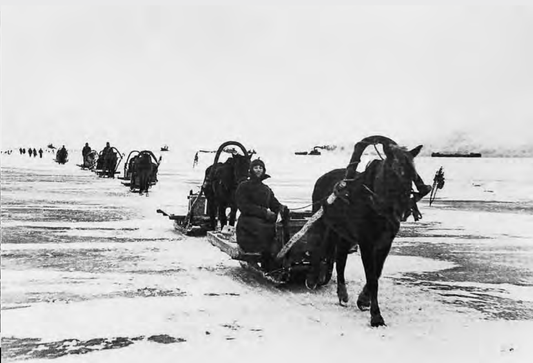
Обозы гужевого транспорта на льду Ладожского озера