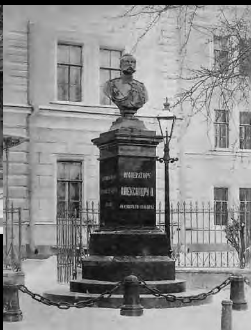
Бюст императора Александра II перед входом в больницу. Фото кон. XIX в.