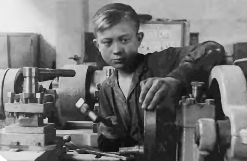
Заменил отца. 1941 г.

сам изготовил и смонтировал в нашей комнате печку-буржуйку, подшивал мои и мамины валенки, изготовил лампадку, две зажигалки из патронных гильз, масляную (на солярке) лампу на случай отключения электричества, залудил железную кастрюлю и бидон.