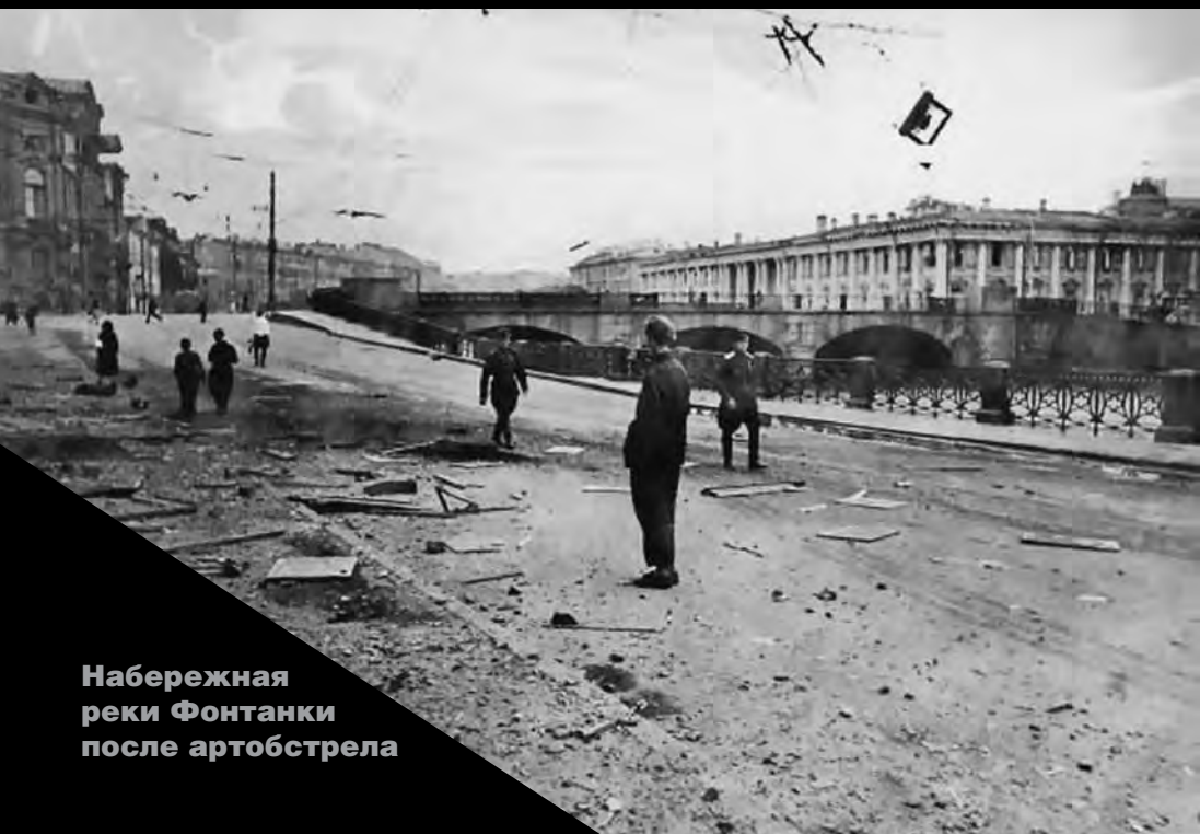
Набережная реки Фонтанки после артобстрела