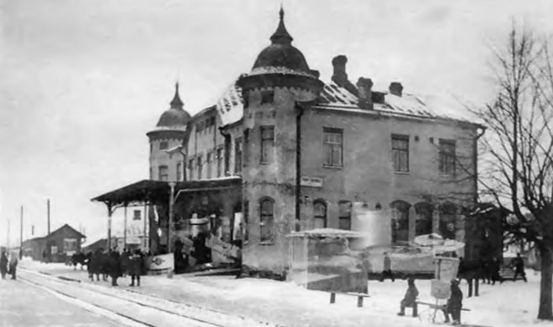
Станция поселка Парголово