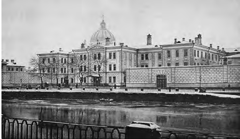
Набережная реки Фонтанки напротив главного входа в Александровскую больницу. Фото XIX в.

Такую рыбу в Ленинграде до войны, кроме малолетних мальчишек, никто не ловил. Да и они ловили ее только ради развлечения, так как даже кошки ее не ели. Но, когда в Ленинграде начались перебои с продуктами, такой вид рыбалки очень пригодился. Такую рыбу можно было прокрутить через мясорубку и потом из этого фарша сделать котлеты. Получалось очень вкусное, по блокадным меркам, и очень калорийное блюдо. На такую рыбалку можно было ходить только в безветренный, желательно солнечный день. Если был ветер, шел дождь или была очень мрачная пасмурная погода, такая рыба не ловилась. Мешали такой рыбалке также немецкие обстрелы и бомбежки.