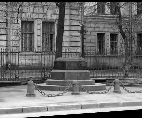
Памятник «Человеку-невидимке». Современный вид