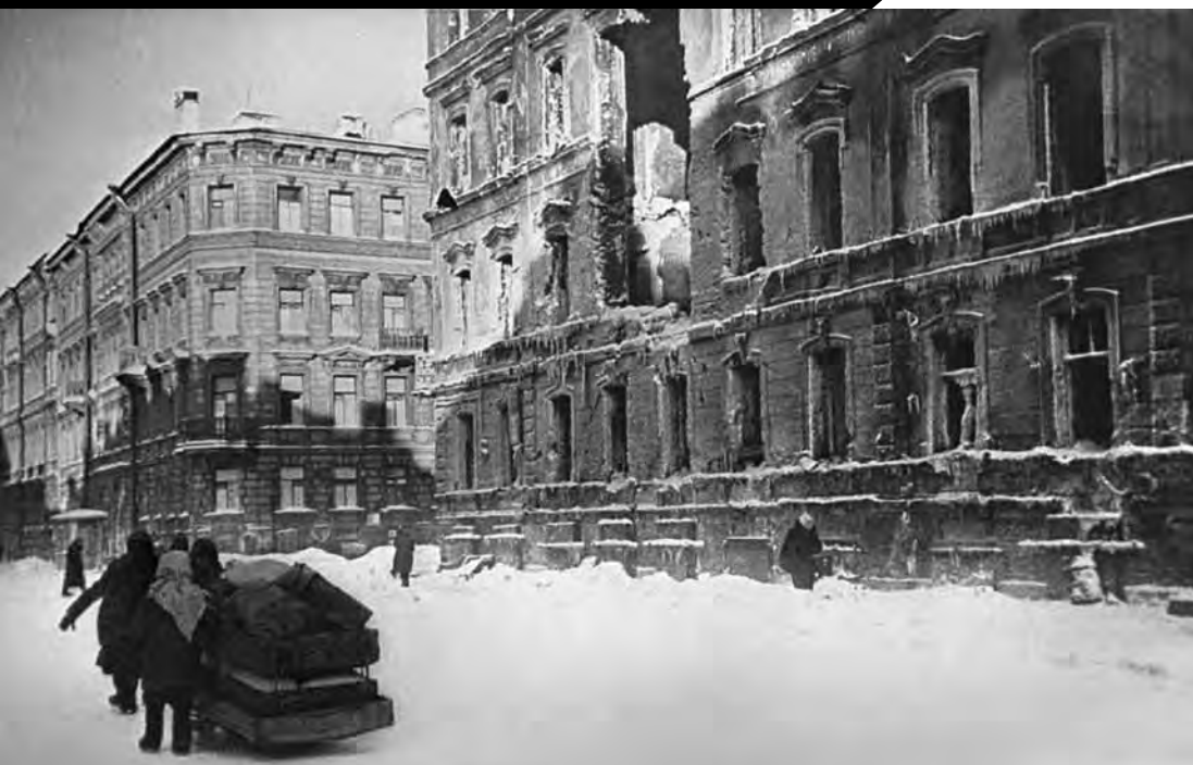
Центральный район. Улица Правды, дом №12