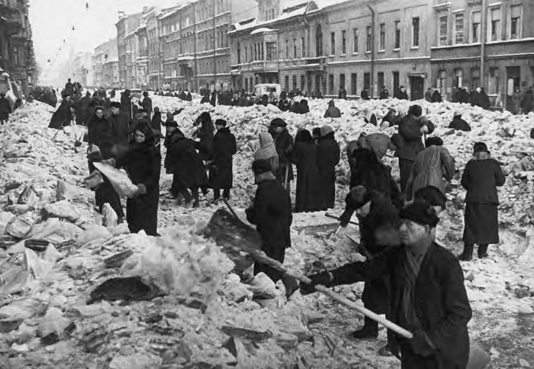
Ленинградцы на очистке улиц города