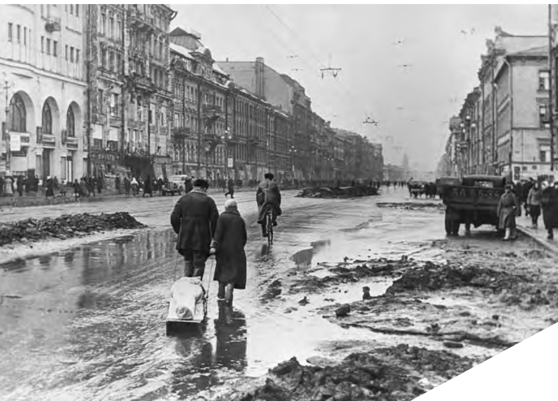
Проспект 25-го Октября (Невский проспект). Весна 1942 г.