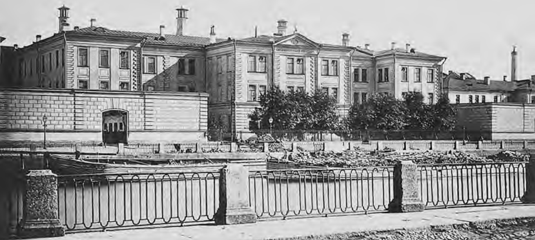
Александровская больница. Фото кон. XIX в.