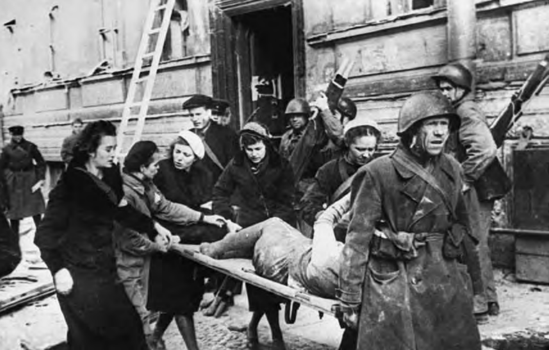
Помощь пострадавшим от бомбежки