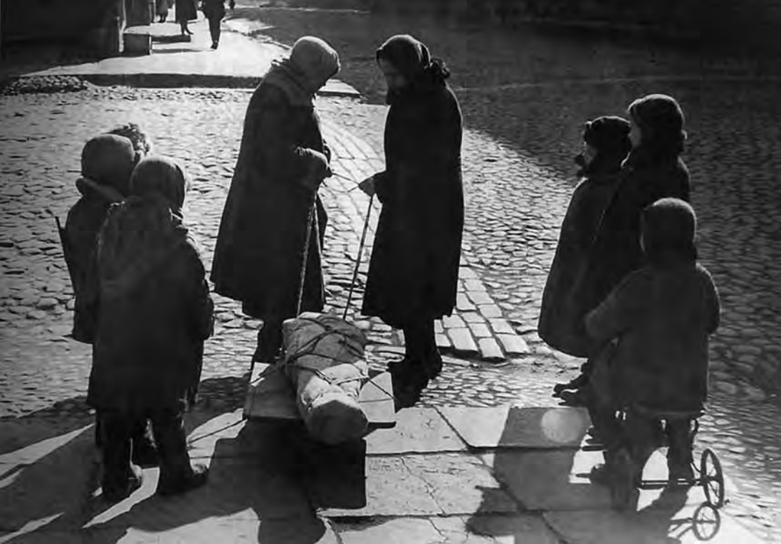
Жизнь и смерть блокадного ребенка