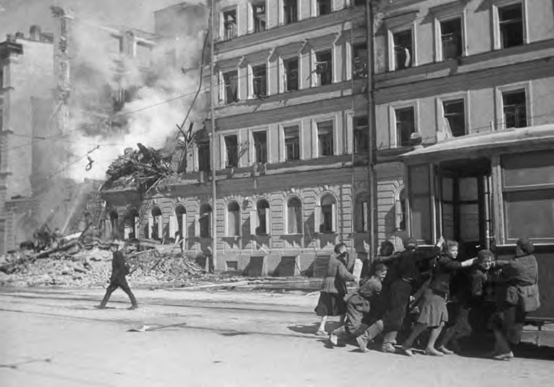
Будни блокадного Ленинграда