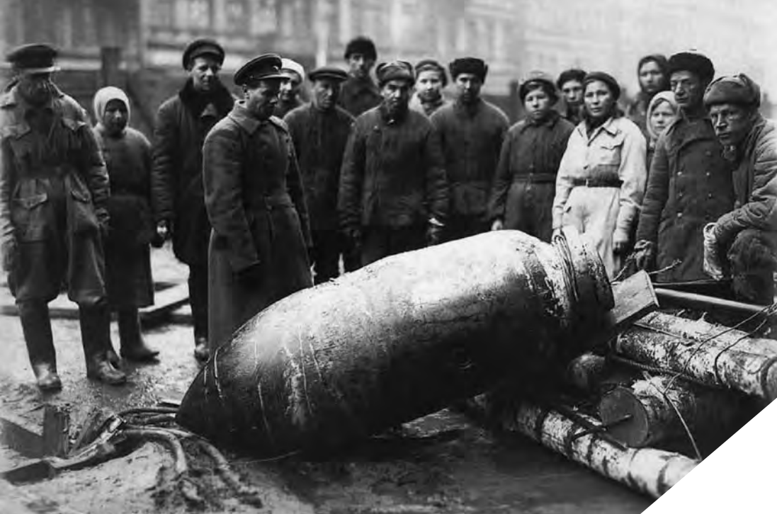
Неразорвавшаяся немецкая авиабомба