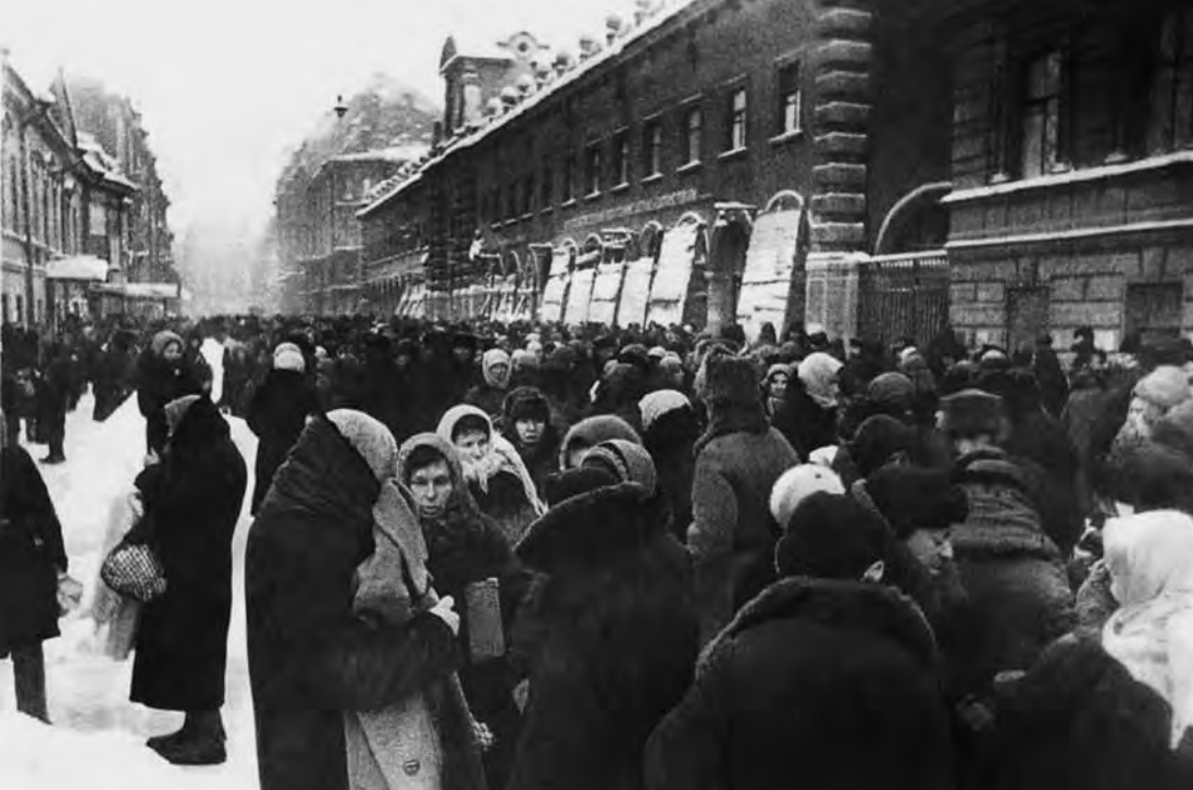
Толкучка у Кузнечного рынка. Зима 1942 г.