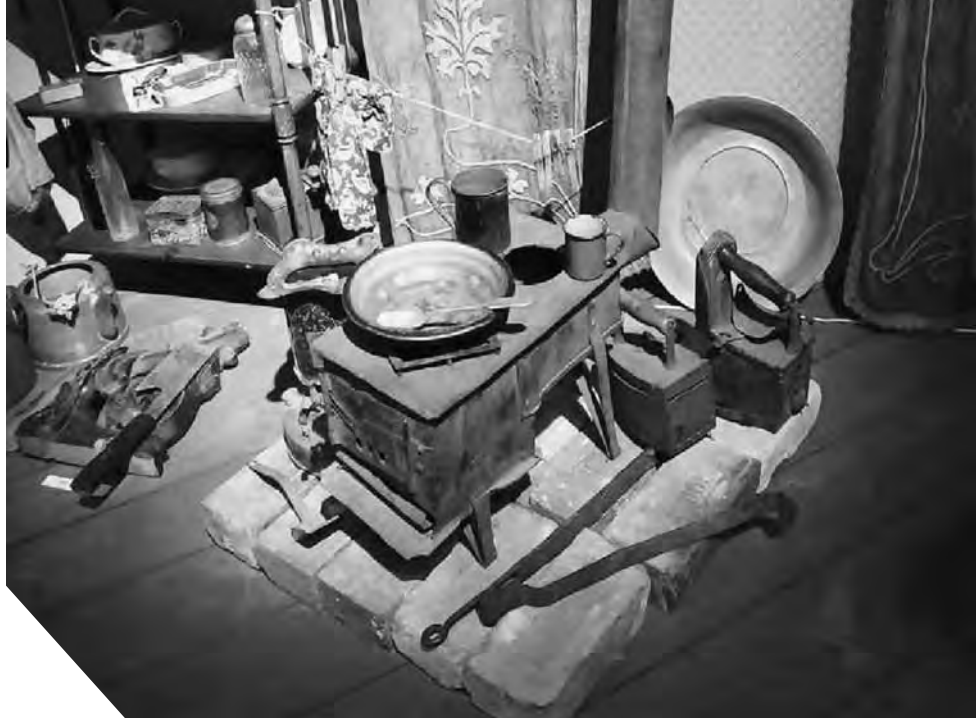
Печка-буржуйка. Музей обороны и блокады Ленинграда

отправят в детский дом. Кроме того, я попробовал в этот вечер всякой вкуснятины, а в комнате было тепло, пахло вкусной пищей, махоркой, овчиной. Дядька пытался меня будить для очередной кормежки, но я упорно не хотел просыпаться. Только под утро сквозь сон слышал, как дядька последний раз перед уходом кормил маму кашей. Дядька оставил нам почти все продукты и противогазную сумку, в которой лежало почти полторы тысячи рублей. Эти деньги в основном купюрами по три, пять и десять рублей собрали в папином подразделении, на передовой их тратить было негде, а в городе на них все же можно было хоть что-то купить. Кроме того, все на передовой знали, что каждый грамм продуктов или каждый рубль может спасти в Ленинграде чью-то жизнь.