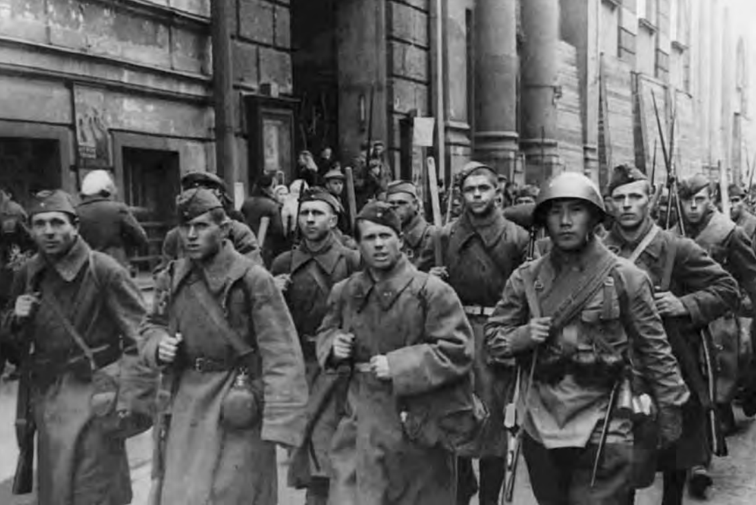
Части Красной Армии, направляясь на фронт, проходят по улицам города. 1941 г.

В такую щель могло поместиться около 100 человек. Ее стены и потолок были обшиты досками, внутри щели была сделана скамейка, а сверху на крышу было насыпано примерно 0,5 метра земли.