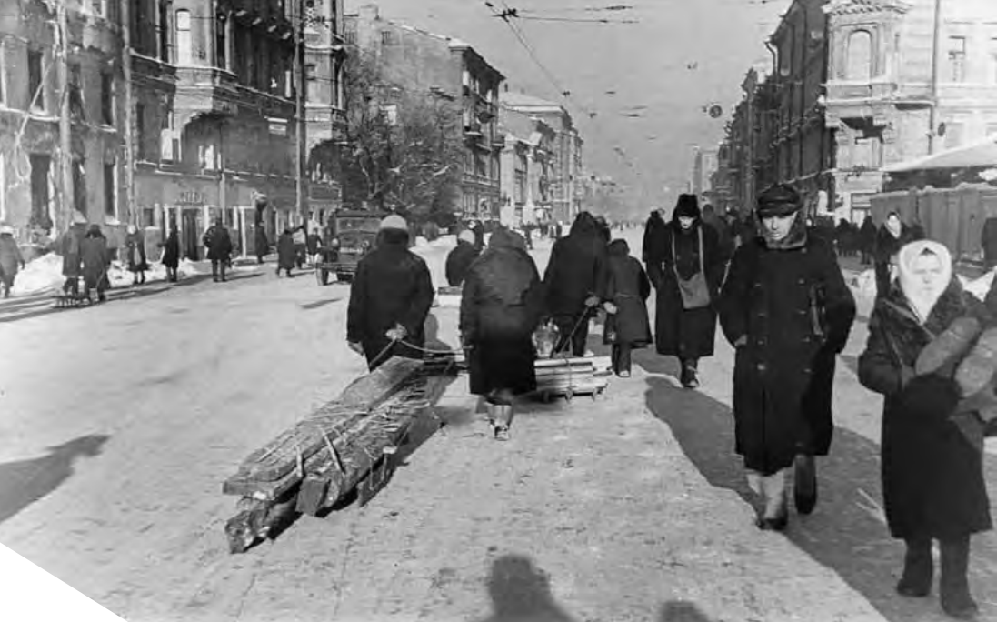
Международный (Московский) проспект. Февраль 1942 г.

не хватало. Воду в эту прачечную приходилось вручную приносить из Фонтанки.