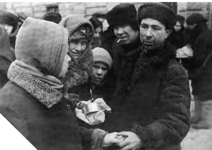
Обмен вещей на продукты

Пётр I хотел и строил Петербург как северную Венецию на реке Неве и на берегу Финского залива. Город пересекают множество рек и каналов. Рядом с городом находится Финский залив. Всего в 50 км находится громадное