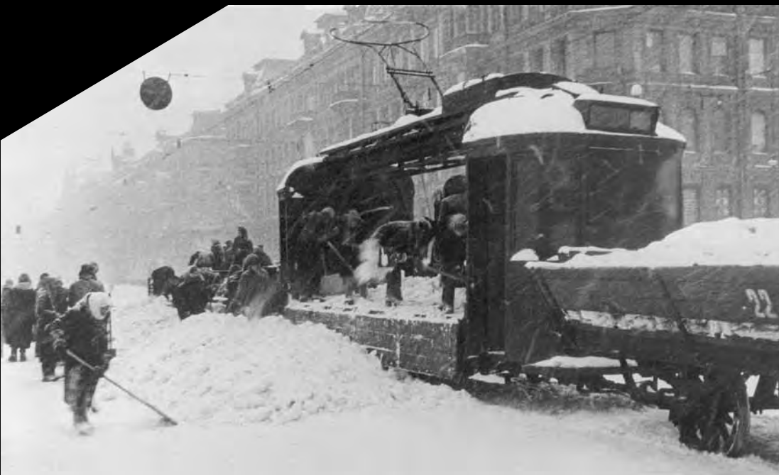
Грузовой трамвай на уборке снега